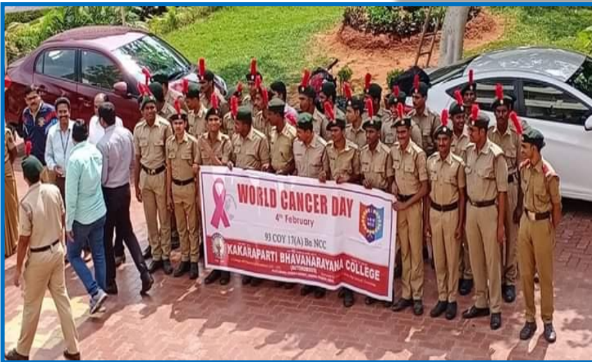
Cadets from various college participating in Rally