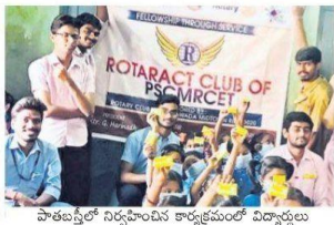
పాతబస్టీలో నిర్వహించిన కార్యక్రమంలో విద్యార్థులు