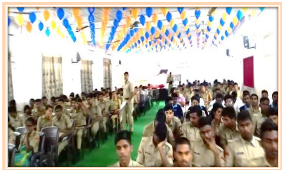
Cadets at the Programme